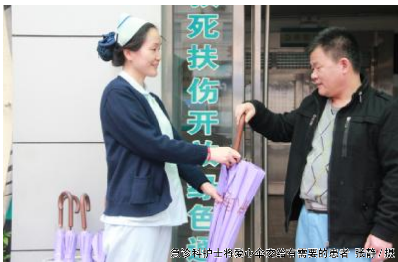
急诊科护士将爱心伞交给有需要的患者