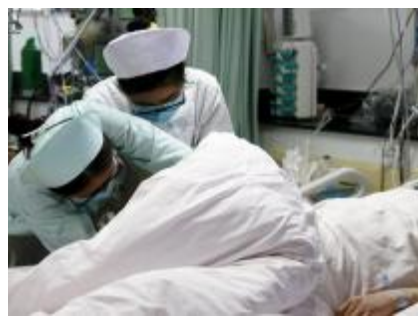
除夕夜坚守岗位的护士们