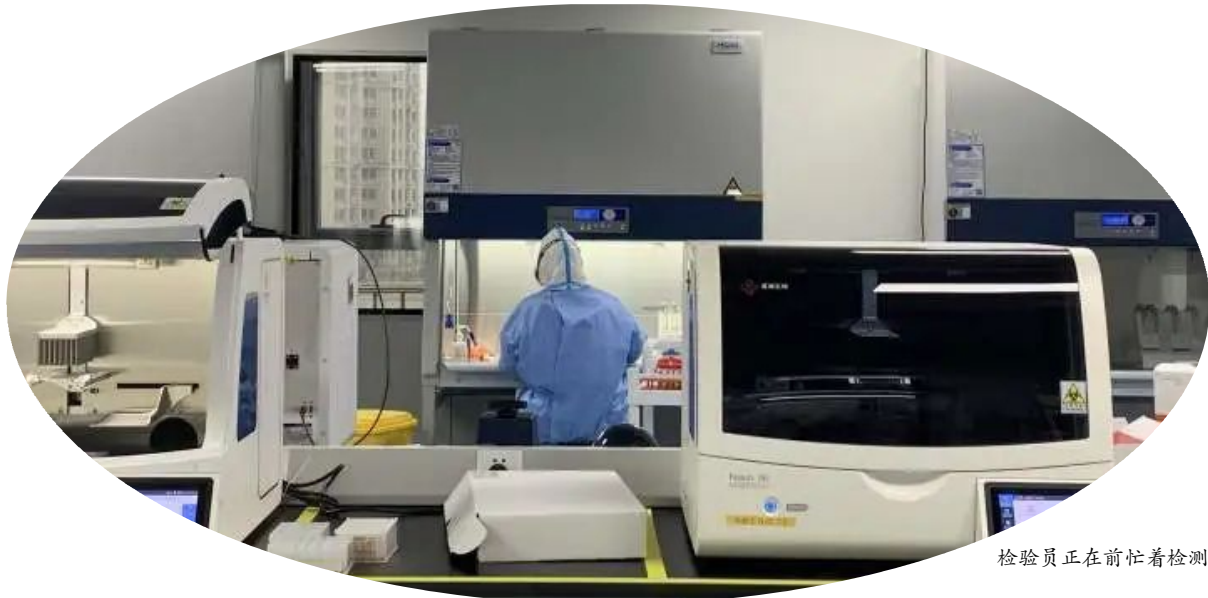
检验员正在忙着检测

疫 情常态化防控下,如今人们的日常生活中,常常得多摺一份证明——核酸检测报告。目前,温州已在4家三甲医院内建成核酸检测基地,区域内日均检测能力超过12万份。从采样到一纸报告出炉,要经历怎样的过程?庞大的检测基数下,检验人员又是如何保证检测的精度和速度?日前,记者走进位于温州市人民医院的城市核酸检测基地,体验了一场特殊的“疫”线守护。