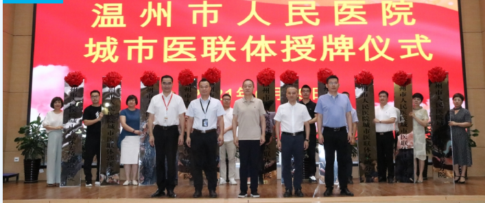
未来,我院将同各单位携手,积极探索和实践医联体新的工作模式,努力实现共建、共享、共赢。